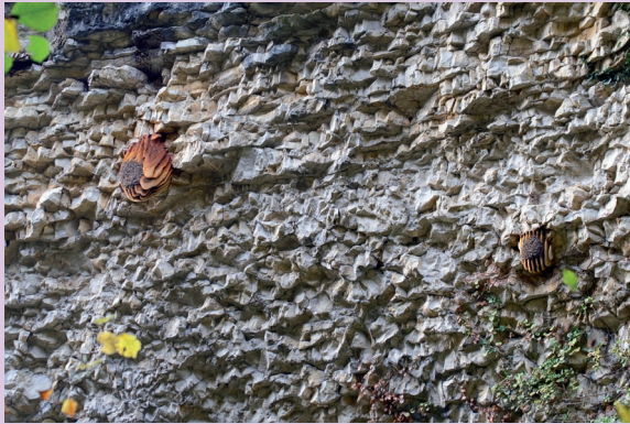
Fig. 2: Due colonie di Apis mellifera che hanno nidificato a poca distanza su un costone di roccia in Valpolicella (VR). Ottobre 2018.

verranno raccolti dall'App saranno elaborati scientificamente, in collaborazione con varie istituzioni e gruppi di ricerca, e poi divulgati mediante pubblicazioni scientifiche e divulgative, conferenze e presentazioni a congressi nazionali ed internazionali e attraverso tutte le diverse modalità con cui la moderna tecnologia permette di comunicare e di informare i cittadini.