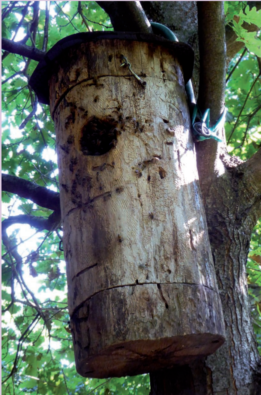
Fig. 3: Una colonia di Apis mellifera insediata dentro un nido artificiale per gufi. Isola Vicentina. Luglio 2020.

svolta da una singola colonia possa coprire un'area anche di oltre 30 km 2 . Le api da miele sono "quantitativamente" gli impollinatori più importanti per le nostre flore spontanee e autoctone ma solo assieme al complesso degli altri apoidei ed impollinatori possono garantire la conservazione della biodiversità vegetale e, quindi, il funzionamento degli habitat terrestri.