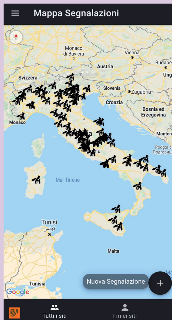
Fig. 7: Mappa delle segnalazioni dell'App BeeWild, aggiornata a fine ottobre 2020.

L'app BeeWild è stata lanciata il 7 agosto 2020 e i primi tre mesi sono stati fondamentali per individuare alcune criticità tecniche che sono in via di risoluzione. Grazie anche ad una buona campagna mediatica, il numero di cittadini che hanno scaricato l'App e ancor di più quello delle colonie censite fino ad oggi è davvero molto promettente.