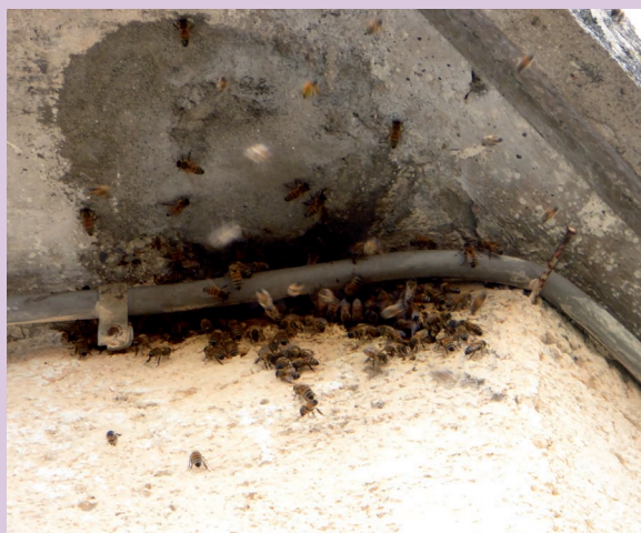
Fig. 6: Una colonia di Apis mellifera insediata dentro una cavità in un edificio nel centro del paese. Rocca di Calascio (AQ). Agosto 2020.

Per segnalare lo stato di una colonia già censita in precedenza si apre invece la mappa, si clicca sull'ape nera che segnala una colonia già censita, e si procede a fornire un nuovo rilievo. Durante lo svolgimento di questa operazione si possono vedere i rilievi precedenti e si può anche scegliere di diventare "Custode" di questa colonia. Anche le ulteriori segnalazioni, prima di comparire nella App, dovranno essere validate dagli esperti. Per la gestione del flusso di segnalazioni che giungeranno attraverso BeeWild, FEM si avvale, oltre che di suo personale esperto, della collaborazione di World Biodiversity Association onlus, da alcuni anni impegnata concretamente nel campo delle api e dell'apicoltura. In futuro tale collaborazione potrà essere estesa ad altre organizzazioni e istituzioni che possano condividere questo importante progetto di censimento e monitoraggio delle colonie non gestite di api da miele.